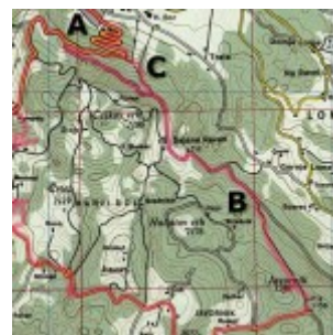
Zadnji del poti

Pot začnemo kar v centru, pri avtobusni postaji.