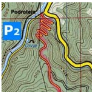
Prvi del poti