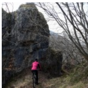
Jarčev kamen