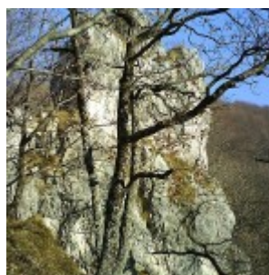
Jarčev kamen