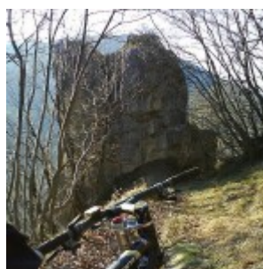
Jarčev kamen