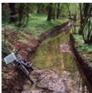
Gorjanci so "polni vode", kar omogoča rast kvalitetnih gozdov

Črna lica je košenica na Gorjancih v bližini Miklavža, kjer uspeva mokovec .