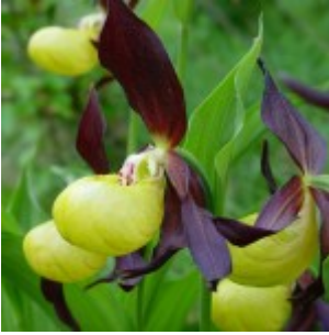
Lepi čveljc ( Cypripedium calceolus )