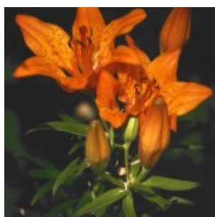
Brstična lilija ( L. bulbiferum )