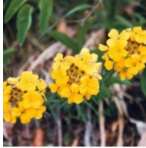
Kranjski šebenik ( Erysimum carniolicum )