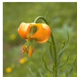
Kranjska lilija ( L. canalicum )