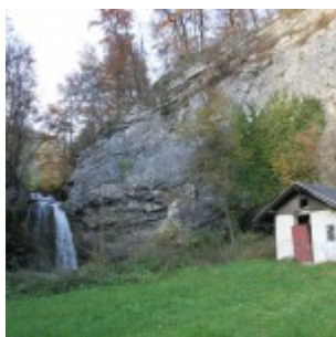
Panorama, ki jo zagledamo z zadnje brvi

Več kot opis pa povedo slike v spodnji galeriji.