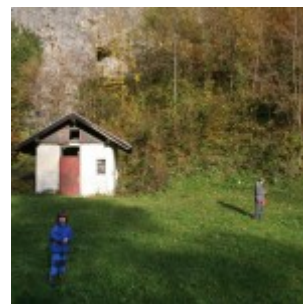
MHE, travnik in tunel v ozadju