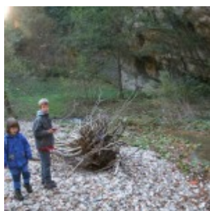
Breg malega jezera pod slapom je prodat