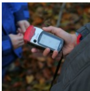
GPS je pokazal pravilno, res smo našli slap :)