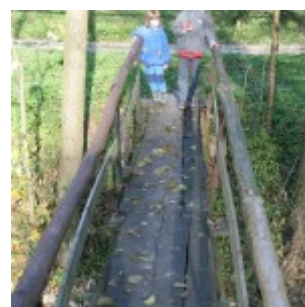
Ta brv je kmalu od asfaltne ceste, ko zavijemo v sotesko.