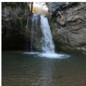
Sopota je res lep slap