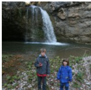
Res je zanimivo