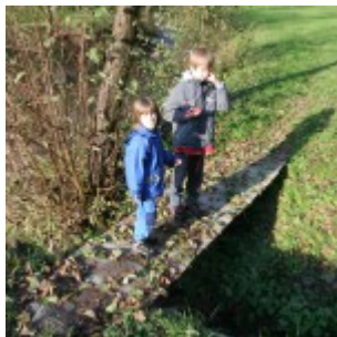
Brv tik pred slapom pelje preko studenčka

Preko nje lahko prečkamo potok in se podamo do slapa po levem bregu potoka.