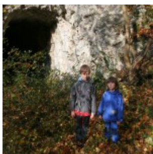
Juhu, gremo raziskovat! Hitro skozi tunel.