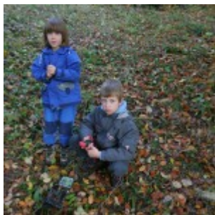
Našli smo geocache